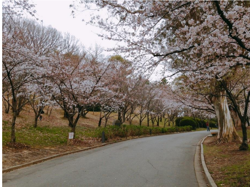
位於津雲台宿舍附近的南千里公園，櫻花滿開的盛況。