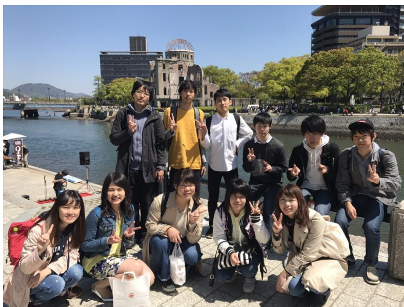
和社團的人一起去了廣島

由於我對運動不太有興趣，抱著想玩遍日本的心，參加了叫作one step的旅行社團，上個禮拜和社團的成員們去了廣島，晚上還一起聊天喝酒，有一種真正融入日本人群之中的歸屬感，雖然社團成員們各個說著一口流利的關西腔，導致我整夜都不懂大家在說什麼，但是整體氛圍很棒，是個與日本人變成朋友的好機會。最酷的是，第二天我們利用搭便車的方式，從廣島搭回了大阪，距離大約是車程五、六小時，可以算是目前我做過最瘋狂的事情之一，而我也安然無恙的從廣島搭回了大阪，雖然有趣但是基於安全問題，還是建議女生們與男生兩人一組比較安全。