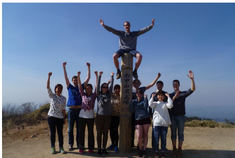
和宿舍的朋友一起去爬了六甲山

關於宿舍的選擇，我覺得地理位置可以優先考慮，再來考慮宿舍整體的氛圍。即使我住在離吹田校區最近的宿舍，每天騎腳踏車大約也要花十五到二十分鐘，再加上往學校的路並不是平坦的路，有許多上坡與下坡，因此每天都在大量運動後開始上課，算是好的生活習慣養成的開始，住在豐中校區或許會方便一些，由於有學校巴士的關係，無論去哪個校區都很方便。