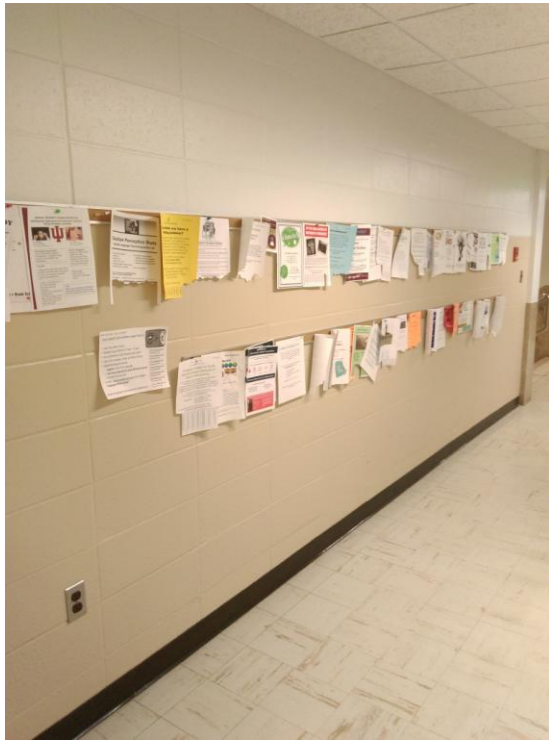
照片：招募期間我們也印製了大量招募宣傳單，張貼在各院系。