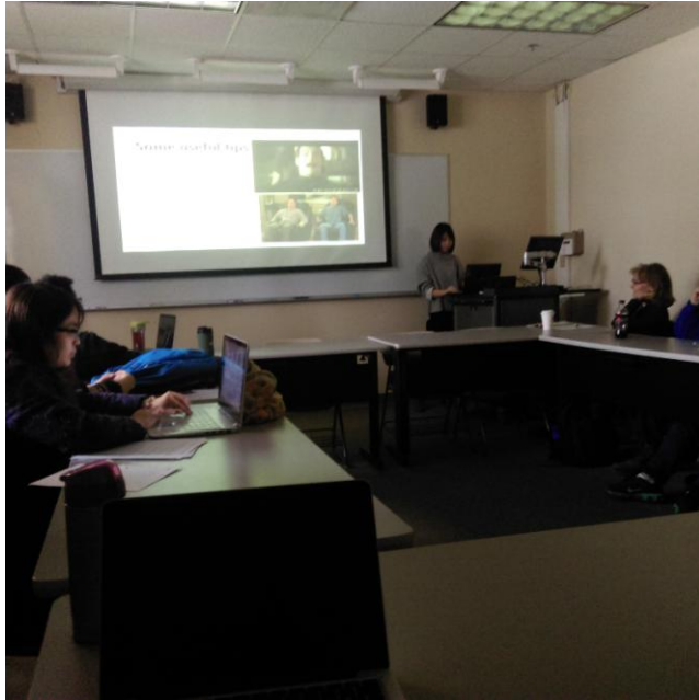
照片：Weekly meeting 時我們以生動活潑的方式介紹眼動儀。