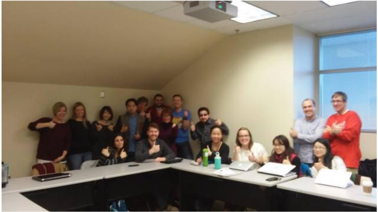
照片：ICR 所有成員合影。